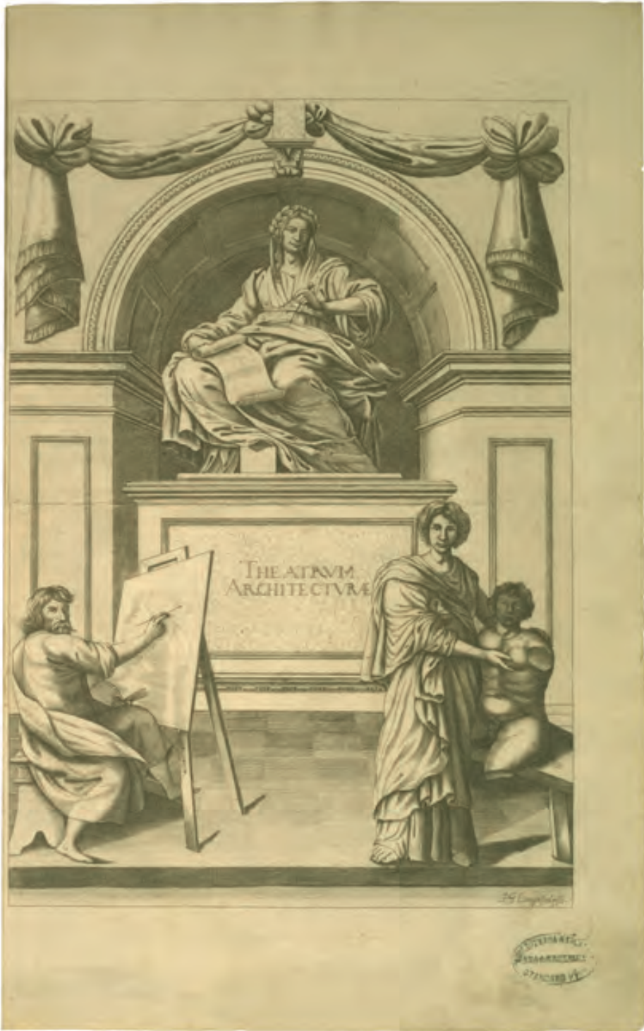
35. Ch. P. Dieussart, THEATRUM ARCHITECTURAE CIVILIS , In drey Bücher getheilet [...] , Bamberg 1697