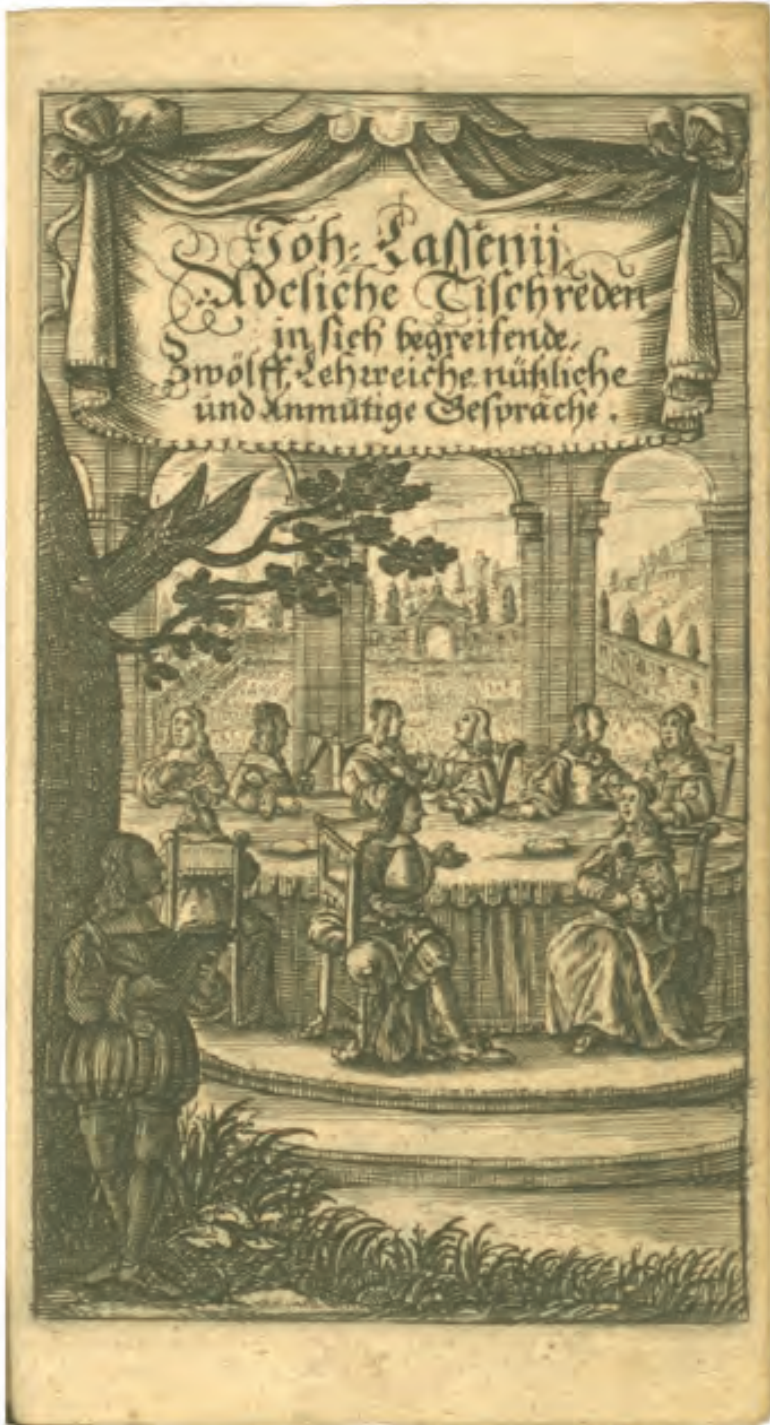
69. J. Lassenius, JOH. LASENII, Adeliche Tisch-Reden in sich begreifende zwölf Lehrreiche / nützliche und anmuthige Gespräch [...] , Nürnberg 1661