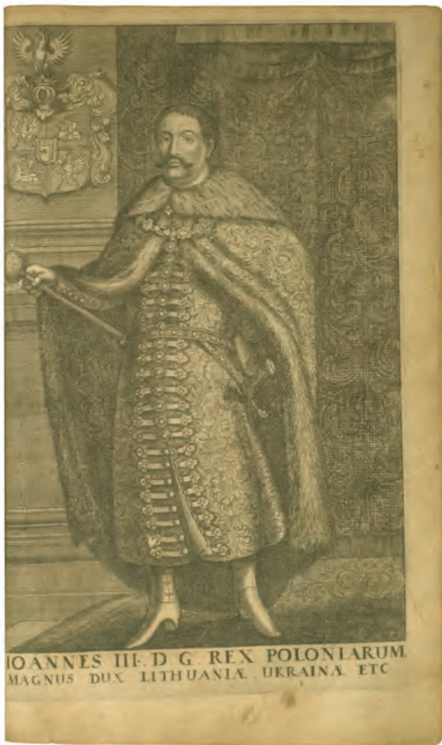
52. Ch. Hartknoch, Alt- und Neues Preussen Oder Preussischer Historien [...], Franckfurt und Leipzig 1684