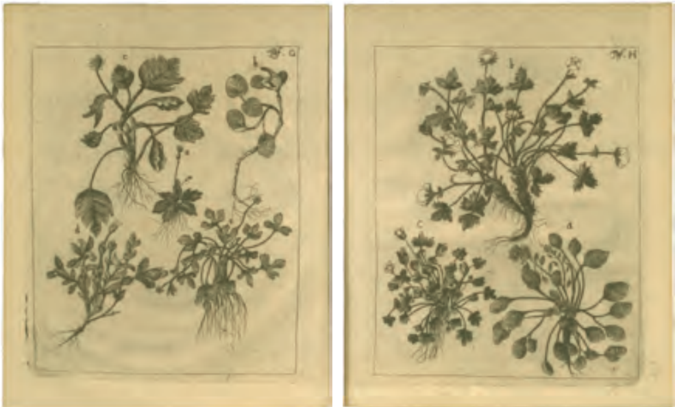
73. F. Martens, Friderich Martens vom Hamburg Spitzbergische oder Groenlandische Reise Beschreibung gethan im Jahr 1671 [...], Hamburg 1675