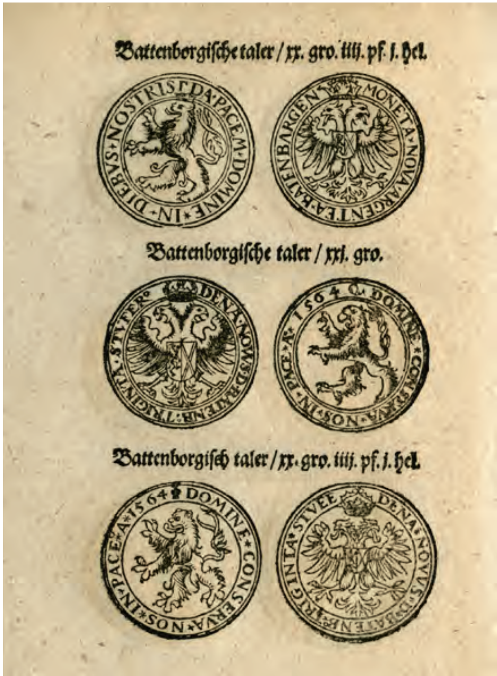
6. Des Churfürsten zu Sachsen vnd Burggraffen zu Magdeburg etc. Ausschreiben Gebot vnd Vortbot die Müntz anlangende nach inhalt des H. Reichs Müntzordnung vnd derowegen auffgerichter Abschiede, [Dresden 1572]