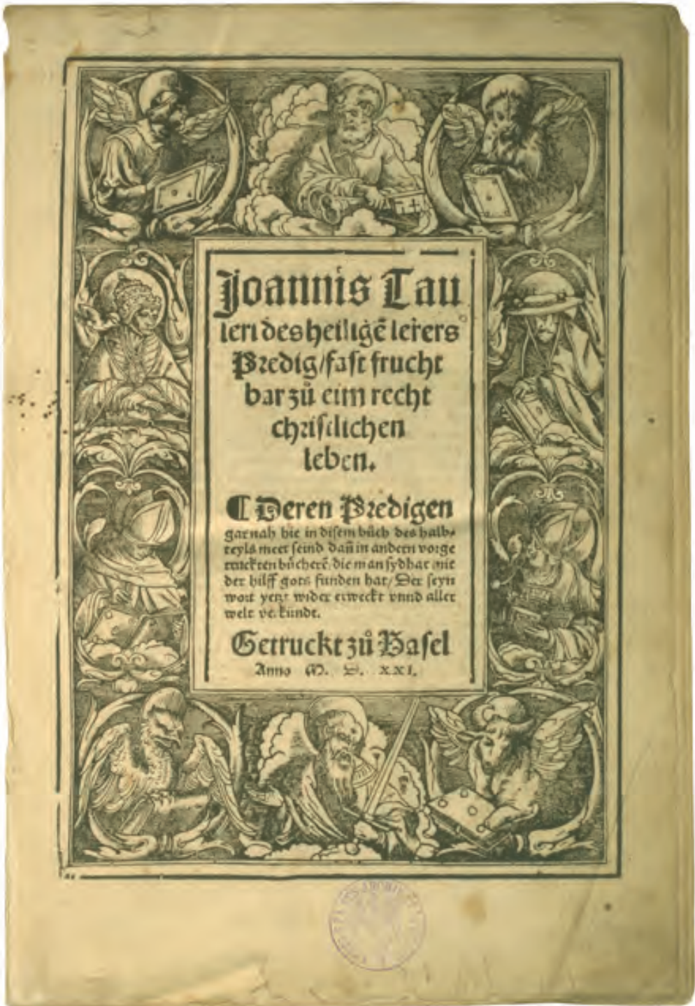
80. J. Tauler, Joannis Tauleri des heiligē lerers Predigfast frucht bar zû ein recht chrislichen leben [...], Basel 1521