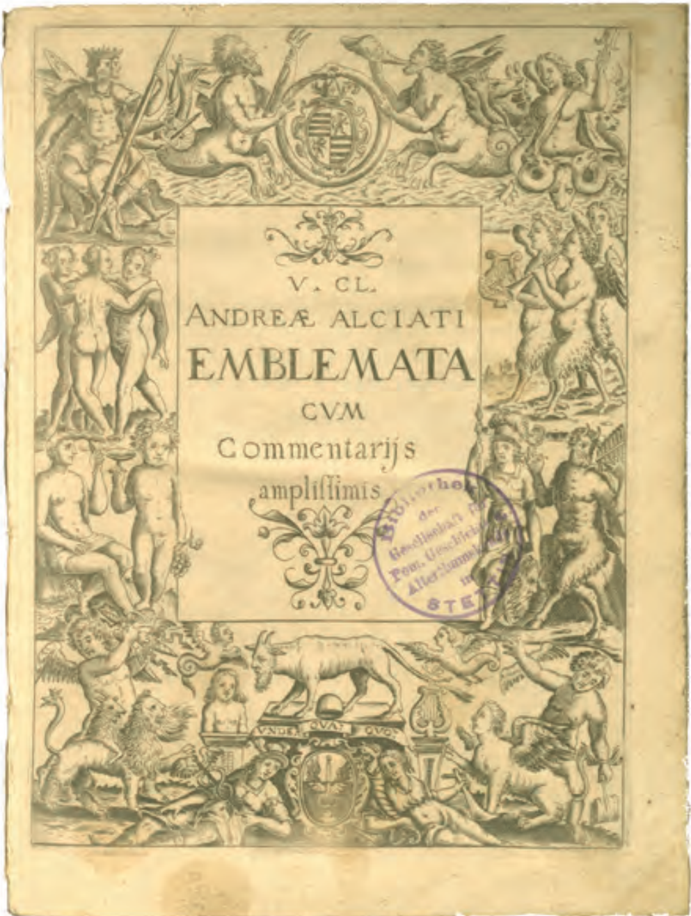
2. A. Alciati, Andreae Alciati emblemata cum commentaris [...], Padwa 1621