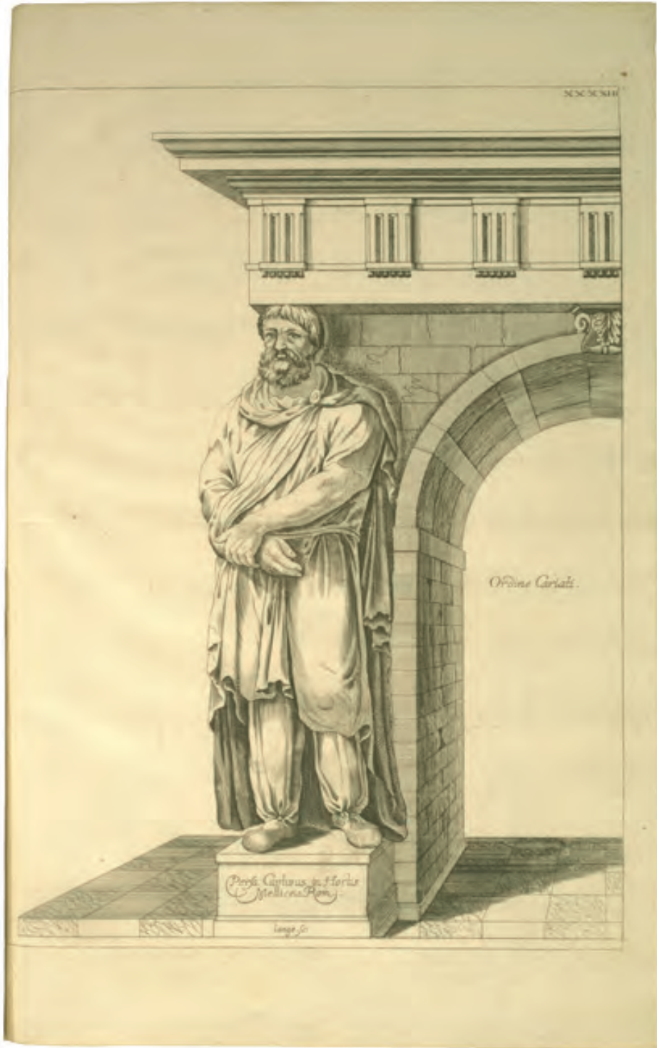
35. Ch. P. Dieussart, THEATRUM ARCHITECTURAE CIVILIS, In drey Bücher getheilet [...] , Bamberg 1697