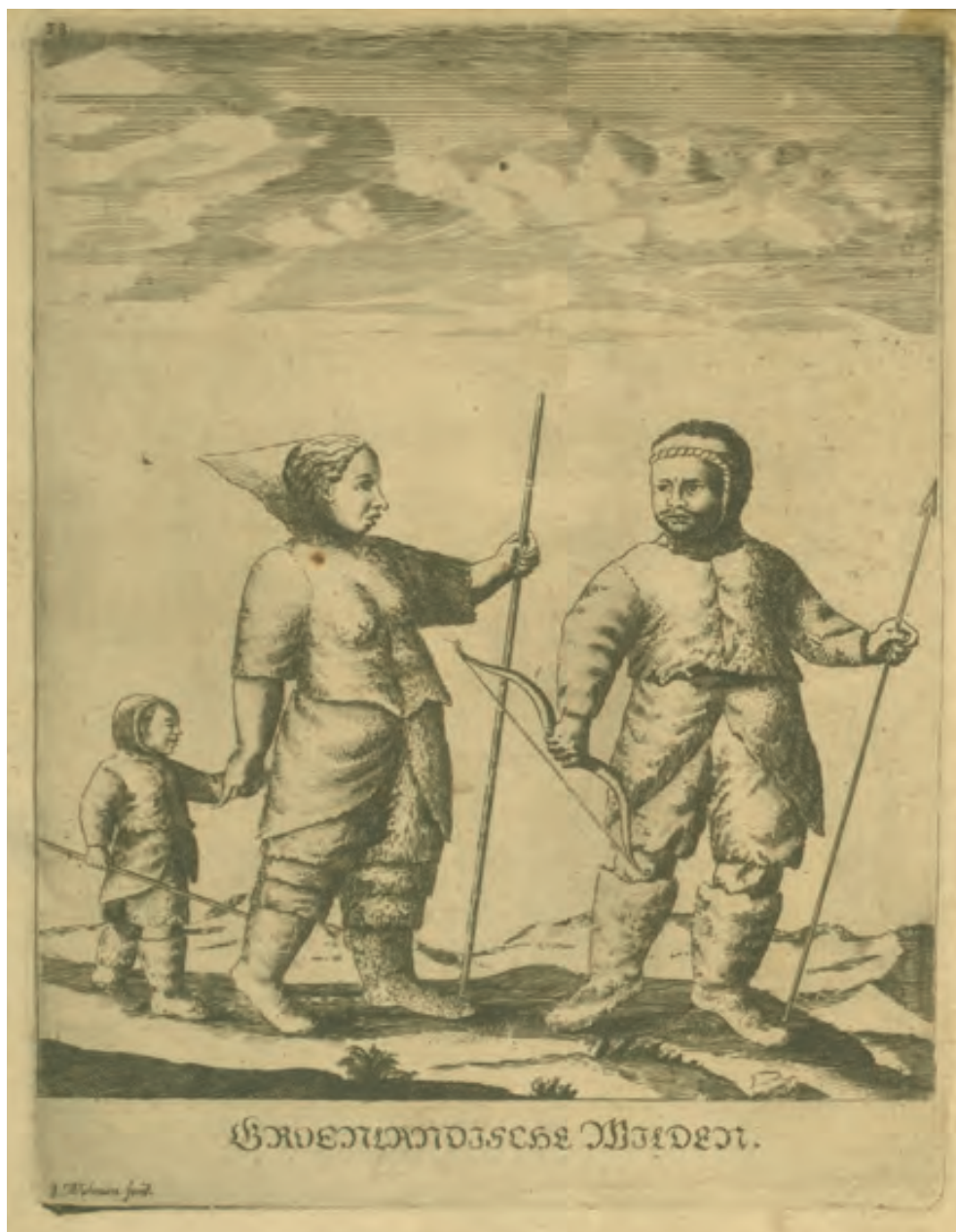
105. I. de la Peyrère, Bericht von Gröenland Gezogen aus zwo Chroniken [...], Hamburg 1647