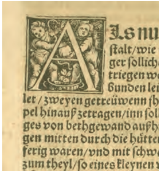
45. Herodianus, Der Fürtrefflich Griechisch geschicht schreiber Herodianus [...], Augsburg 1532