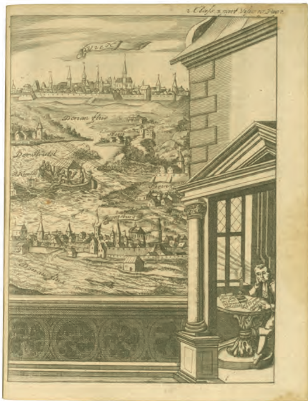
24. A. Cless, Curiosorum, nec non politicorum [...], [Nürnberg] 1679