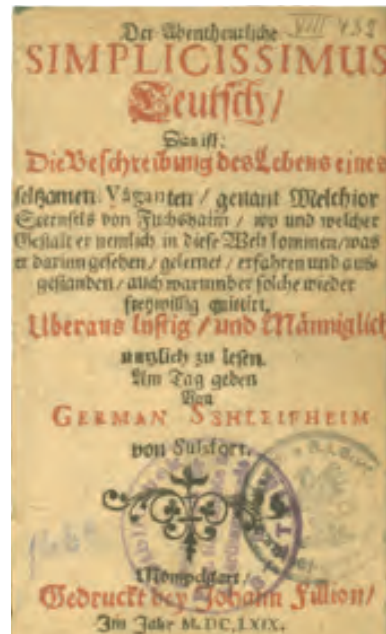
49. Ekslibris i strona tytułowa: H.J.Ch. Grimmelshausen, Der Abentheurliche SIMPLICISSIMUS Teutsch Das ist: Die Beschreibung deß Lebens eines feltzamen Vaganten [...] , Frankfurt/Main 1669