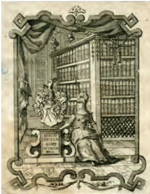
68. Ekslibris zamieszczony w książce: Reinke de Vos, De Warheyt my gantz fremde ys De Truwe gar seltzē dat ys gewiſ [...], Rostock 1549