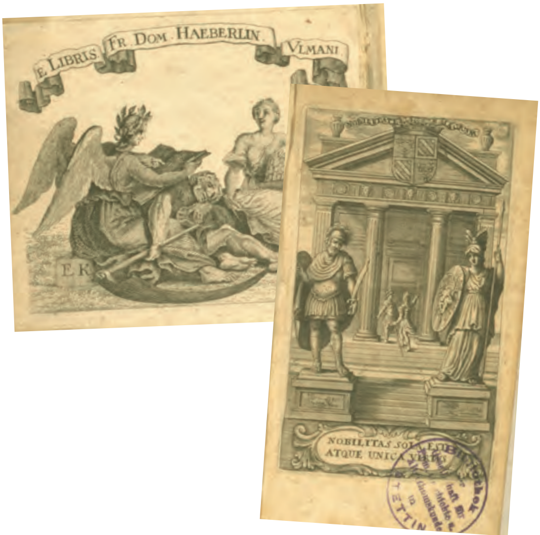
80. Ekslibris i frontispis w dziele: C.F. Menestrier, LA SIENCE DE LA NOBLESSE OU LA NOUVELLE METHODE DU BLASON [...], Paris 1691