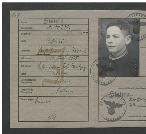
Kenkarta zachowana w Archiwum Państwowym w Szczecinie

Z 12 na 13 lutego 1940 roku do mieszkań szczecińskich Żydów i innych miejscowości Prowincji Szczecińskiej wtargnęli kierowani przez Gestapo żołnierze, wręczając domownikom policyjne zarządzenie dotyczące ich "ewakuacji" do Generalnej Gubernii. Była to pierwsza w Niemczech deportacja Żydów - obywateli Rzeszy.