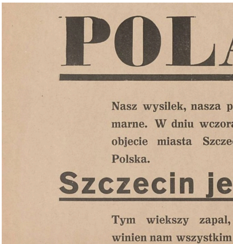
Afisz z 7 lipca 1945 r., informujący polskich mieszkańców Szczecina o przejęciu miasta przez polską administrację i włączeniu go tym samym do granic państwa polskiego.

REGION | 2024-07-05 17:33 | ALEKSANDER MAKOWSKI