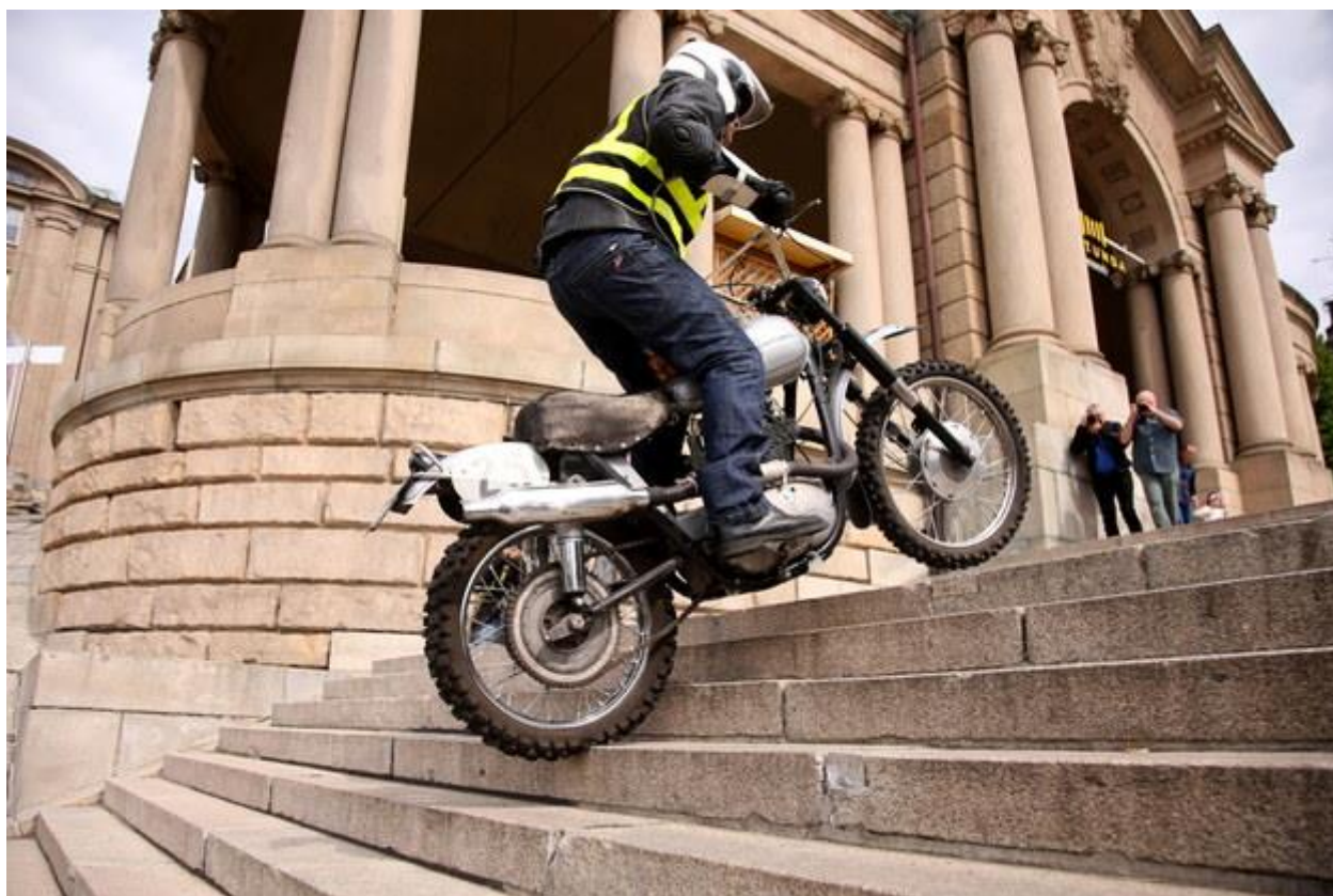
Motocykliści na maszynach "Junak" wjeżdżają na schody przy Wałach Chrobrego w Szczecinie

Choć Międzynarodowy Dzień Archiwów (MDA) jest obchodzony 9 czerwca, to tegoroczna odsłona MDA w Szczecinie odbyła się w sobotę. Jak informuje szczecińskie Archiwum Państwowe, przed południem - w ramach MDA - miało miejsce "odtworzenie przez paru śmiazków z Dzikiego Junaka wjazdu z 1961 r. na motocyklach po schodach na Wałach Chrobrego".