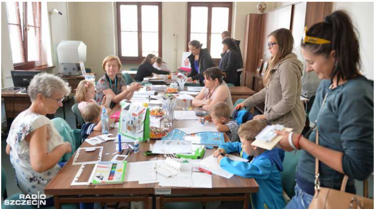
Dzień otwarty w Archiwum Państwowym w Szczecinie.