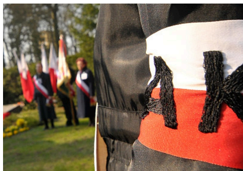
Rocznica powstania Armii Krajowej.

zorganizowana. W momencie maksymalnej zdolności bojowej liczyła niemal 400 tysięcy żołnierzy.